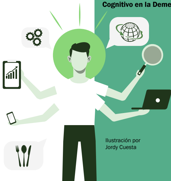
Ilustración por Jordy Cuesta

Dispositivo electrónico para ayudar a los niños con discapacidad a aprender el abecedario en sistema Braille ..... 16