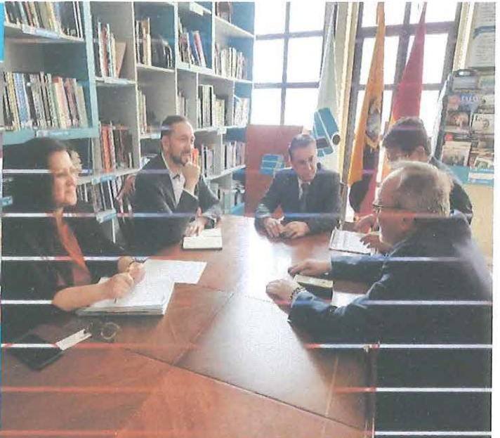
Conversatorio con "La Universidad en Internet"